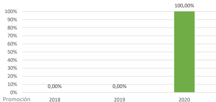
Evolución de la Tasa de inserción laboral