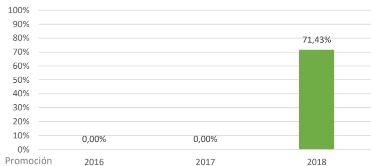
Evolución de la Tasa de inserción laboral