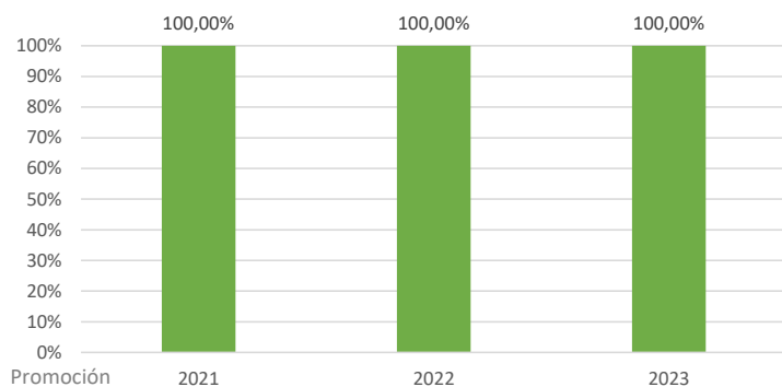
Evolución de la Tasa de inserción laboral